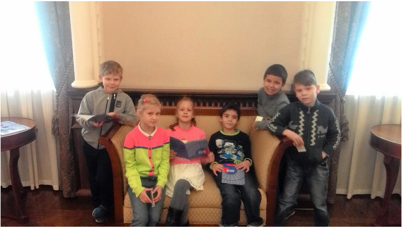
Шумный и веселый 8 «А» класс на премьере спектакля музыкального театра «Ханума»!